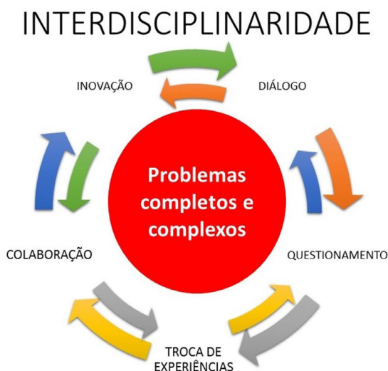
Figura 1 – Representação da Interdisciplinaridade para a solução de problemas complexos

fundamental para que os discentes não apenas conheçam teorias e definições, mas sim para que eles consigam visualizar a gama de situações que, diante de sua complexidade resolutive e abrangência social, se enquadram como complexos. Além disso, possibilita-lhes mensurar, ainda de subjetivamente, a relevância da interdisciplinaridade no intuito de sua resolução.