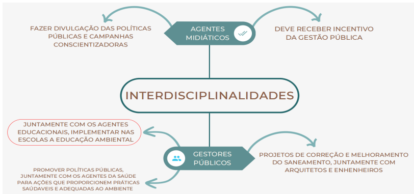
Figura 3 – Plano de ação referente ao saneamento básico