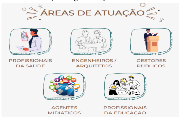
Figura 2 – Áreas de atuação sugeridas pelos discentes