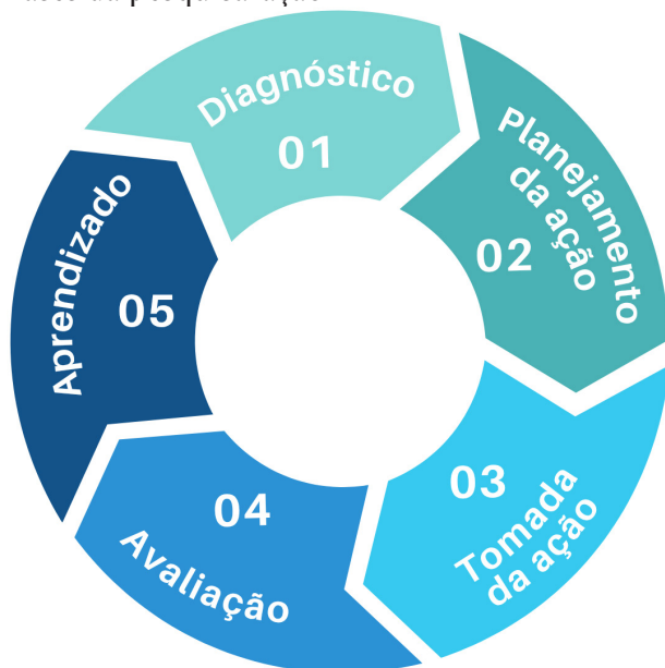
Figura 1 – Fases da pesquisa-ação

Fonte: Adaptado de Engel (2000) e Tajara et. al. (2013).